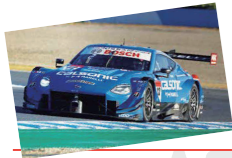
SUPER GT (GT500クラス)チャンピオン #12 TEAM IMPUL