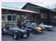
「スーパー7」が何台 も並ぶ景色は希少で、 感動もの