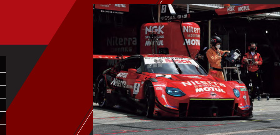
開幕戦の岡山では難しいコンディションの中、2位を獲得